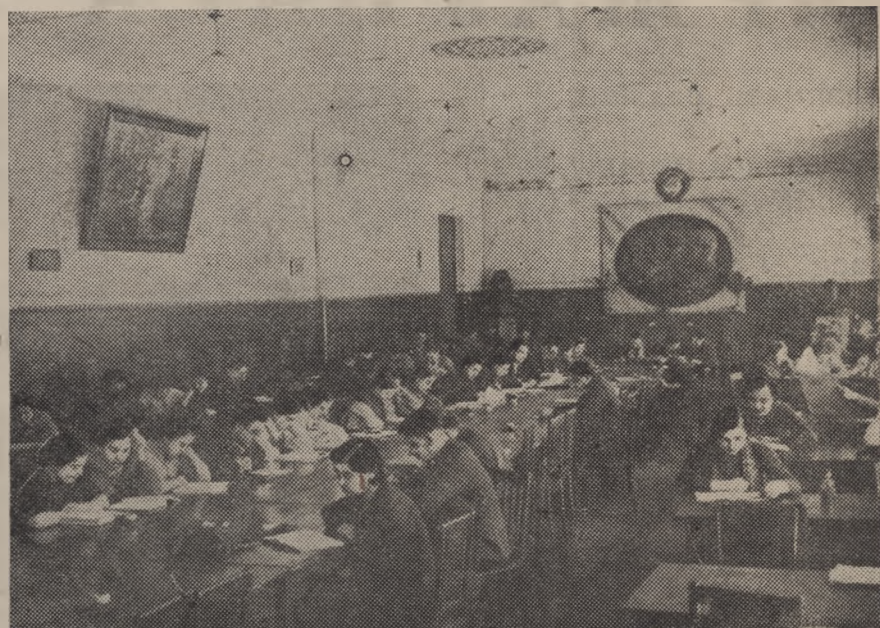
Бібліятэка ўніверсітэта — адна з багатейшых бібліятэк сталіцы рэспублікі. У ёй налічваецца каля 106.500 тамоў навуковай, вучэбнай і мастацкай літаратуры. На здымку: агульны выгляд чытальнага зала бібліятэкі.

Адрас завочнага аддзялення: г. Мінск, Універсітэцкі гарадок, фізіка-матэматычны корпус, завочнае аддзяленне БДУ. РЭКТАРЫЯТ.